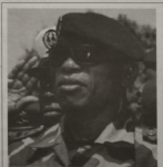
Plus d'un million de personnes ont manifesté le 17 octobre à Madrid contre le projet de loi qui libéraliserait la politique sur l'avortement en Espagne.

RJ - Conakry | L'embargo d'armes représente un autre coup pour déstabiliser le régime militaire du capitaine Moussa Dadis Camara en Guinée.