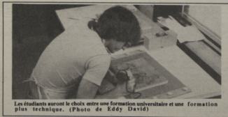
Les étudiants suront le choix entre une formation universitaire et une formation plus technique.