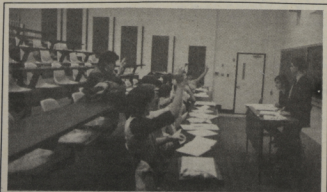
Les membres du conseil d'administration de la FEUM.

temps partiel se joignent aux membres de la FEUM. Les étudiants à temps partiel paieraient ainsi une cotisation à la FEUM. Selon M. Lord, ces étudiants bénéficieraient des mêmes avantages et des mêmes services que les étudiants à temps plein. « Les fonds supplémentaires pourraient concrétiser l'établissement d'une maternité sur le campus », a lancé le président de la FEUM. Signalement que ce projet n'est qu'au stade de la réflexion.