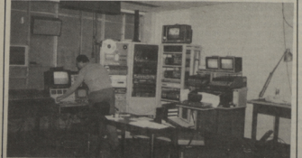
Cette photo laisse apercevoir une partie du studio de T.V.

L'équipement actuel vaut environ 45 mille dollars et, d'après M. Vienneau, il faudrait investir beaucoup d'argent pour avoir un équipement adéquat permettant d'obtenir une bonne qualité technique au niveau de la production. «Pour que l'Administration de l'Université donne plus d'importance au studio, faudrait que d'autres programmes, modules ou départements, l'utilisent», explique M. Vienneau. «Des démarches ont été entreprises en ce sens», a-t-il ajouté. Les dirigeants du Centre audio-visuel ont déjà communiqué avec les professeurs associés au module Information et Communication, pour les inviter à utiliser le studio de télévision dans le cadre de certains cours. Mais d'autres programmes et départements pourraient profiter des services offerts du Centre audio-visuel dans le domaine de la production télévisée. Par exemple, les ressources du programme de gérontologie pourrait produire des émissions destinées aux vieillards.