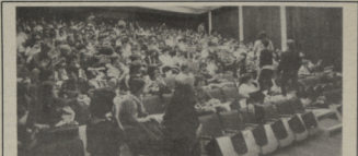
Plusieurs étudiants se sont présentés à l'assemblée générale de la FEUM, jeudi dernier.