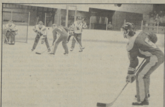
Une séquence prise lors de la Finale remportée par les Aigles.