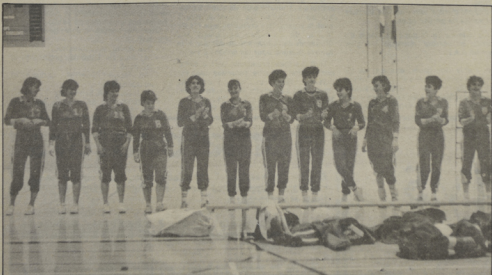
La formation de la polyvalente Mathieu-Martin, championne du tournoi de volley-ball féminin des écoles secondaires.

Classe compétitive: Jeudi 31 octobre à 18h30 Les informaticiens 85-86 vs Labatt Lin à 19h45 Ed. phys. et Loisirs vs Les Eloizes à 21h00 Les Mars Teaux.