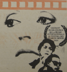
GAGNANT DU CONCOURS DE LA PRESSE INTER-ALBUM ET FESTIVAL DE MONTREAL

Auteurs d'un film d'essai dans la lignée de Marguerite Duras, Strass Cailé, Léa Pool, Scén. L. Pócs, une personnalité plus affirmée dans ce qui suit sur le rapport entre la fiction et la réalité. Le thème est intéressant et offre des points de prises sur le tournage d'un film. La mise en scène cultive un ton mélancolique apprécié en favorisant les coulisses tristes et les échanges confidentiels. L'interprétation est plus qu' satisfaisante. (4)